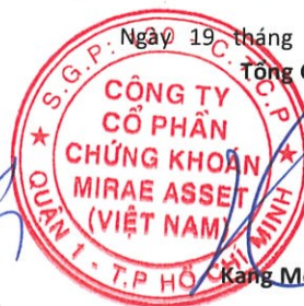
Kang Moon Kyung